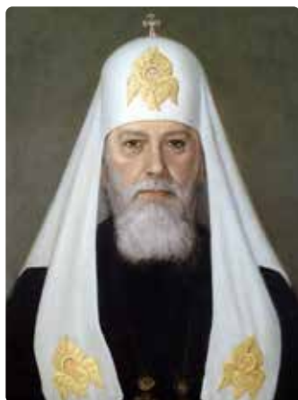
АЛЕКСИЙ I (Симанский Сергей Владимирович) Патриарх Московский и всея Руси (1945-1970)