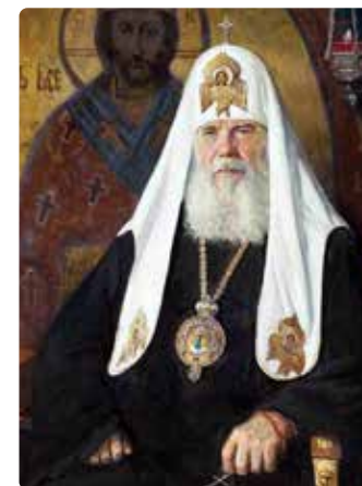
АЛЕКСИЙ II (Ридигер Алексей Михайлович) Патриарх Московский и всея Руси (1990-2008)

В своем Первосвятительском служении Патриарх Пимен был продолжателем церковного делания Патриархов Тихона, Сергия, Алексия I. Одной из важнейших сторон деятельности Патриарха Пимена было укрепление отношений между Православными Церквями разных стран, развитие межправославных отношений. В июне 1988 года Патриарх Пимен возглавил торжества, посвященные Тысячелетию Крещения Руси, и Поместный Собор Русской Православной Церкви.