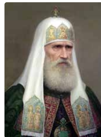
ИОАСАФ II Патриарх Московский и всея Руси (1667-1672)

В своей деятельности Патриарх Иосиф большое внимание уделял делу духовного просвещения. По его благословию в 1648 году в Москве было основано духовное училище при Андреевском монастыре — «Ртищевское братство». Именно благодаря Патриарху Иосифу удалось сделать первые шаги к воссоединению Украины (Малороссии) с Россией.