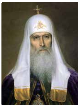
ИОАКИМ Патриарх Московский и всея Руси (1674-1690)