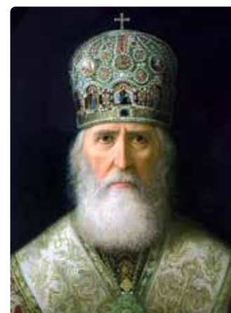
ПИТИРИМ Патриарх Московский и всея Руси (1672-1673)

Отличался глубокой аскетичностью, духовностью, обширными знаниями и получил особое расположение царя Алексея Михайловича. При активном содействии Патриарха Никона в 1654 году состоялось историческое воссоединение Украины с Россией, затем и Белоруссии. Особо проявил себя Патриарх Никон как церковный реформатор: при нем было заменено двуперстное крестное знамение на троеперстное, исправлены богослужебные книги по греческим образцам.