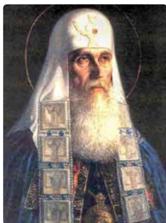
ГЕРМОГЕН Патриарх Московский и всея Руси (1606-1612)

Главной целью своей деятельности считал укрепление в России Православия. По инициативе Патриарха были проведены ряд преобразований в Русской Церкви: учреждены новые епархии, основаны десятки монастырей, начато печатание богослужебных книг. В 1605 году отказался присягать Лжедмитрию и был низложен бунтовщиками.