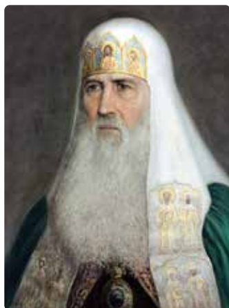
ИОСИФ Патриарх Московский и всея Руси (1642-1652)