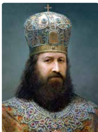
НИКОН Патриарх Московский и всея Руси (1652-1666)

Седьмым Патриархом Всея Руси был избран архимандрит Троице-Сергиевой Лавры Иоасаф. В своей деятельности Патриарх Иоасаф II стремился реализовать и утвердить реформы Патриарха Никона. Он продолжил начатое Патриархом Никоном исправление и издание богослужебных книг. При нем были просвещены народности на северо-восточных окраинах России; на Амуре, на границе с Китаем, был основан Спасский монастырь.