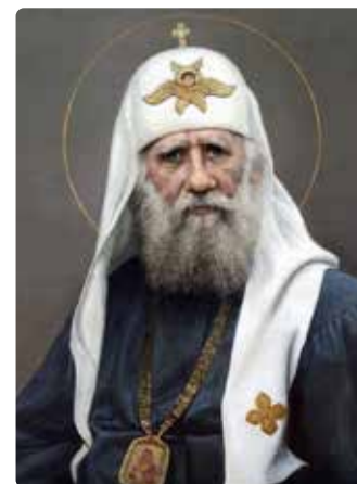
ТИХОН (Белавин Василий Иванович) Патриарх Московский и всея Руси (1917-1925)

Патриарх Адриан был 10-м, последним в досинодальный период, Патриархом Московским и Всея Руси. Деятельность Патриарха Адриана связана в основном с соблюдением церковных канонов и охране Церкви от ереси. Расположенный к старине и неохотно отзывавшийся на реформы Петра I, Патриарх Адриан все же поддерживал важные начинания царя – строительство флота, военные и социально-экономические преобразования.