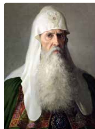
ИОАСАФ I Патриарх Московский и всея Руси (1634-1640)

Федор Никитич Романов-Юрский, после смерти царя Федора, был одним из законных претендентов на Русский трон, так как являлся племянником Иоанна Грозного. Попав в опалу при Борисе Годунове, Федор Романов-Юрский был пострижен в монашество с именем Филарет. В Смутное время Лжедмитрий II захватил митрополита Филарета в плен, где он пробыл до 1619 года. Земский Собор 1613 года избрал на русское царство Михаила Романова, сына митрополита Филарета, утвердив за последним титул Патриарха. Патриарх Филарет стал ближайшим советником и фактическим соправителем царя Михаила.