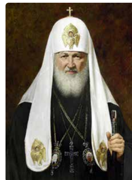
КИРИЛЛ (Гундяев Владимир Михайлович) (род. 1946) Патриарх Московский и всея Руси (2008 - н.в.)

С предстоятельством Алексия II связано время возрождения и духовного расцвета Русской Православной Церкви: открылись тысячи храмов и монастырей, в том числе Храм Христа Спасителя; началась активная подготовка кадров священнослужителей, открылись новые учебные заведения. 17 мая 2007 года произошло эпохальное событие в истории Русской Церкви - был подписан Акт о каноническом общении между Русской Православной Церковью московского патриархата и Русской Православной Церковью Заграницей.