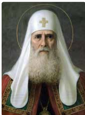
ИОВ Первый Патриарх Московский и всея Руси (1589-1605)