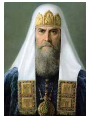
ФИЛАРЕТ Патриарх Московский и всея Руси (1619-1633)

Патриаршество священномученика совпало с трудным периодом в русской истории — Смутным временем. Он открыто выступал против иноземных захватчиков, против возведения на русский престол польского королевича. Во время голода, начавшегося в Москве, Патриарх приказал открыть для голодающих монастырские житницы. При осаде Москвы войсками Минина и Пожарского святитель Гермоген был низложен поляками и заключен в Чудовом монастыре под стражу, где умер от голода и жажды.