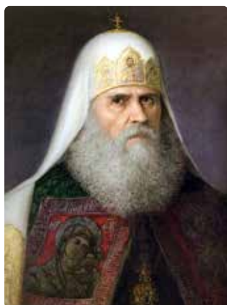
АДРИАН Патриарх Московский и всея Руси (1690-1700)

Правление Патриарха Иоакима пришлось на трудные для государства и Церкви годы. Усилия Патриарха Иоакима были направлены на борьбу против иностранного влияния на русское общество. Проявил себя Патриарх Иоаким и в области государственного управления: он выступил посредником между противоборствующими сторонами во время возникшей смуты в вопросе о престолонаследии в 1682 году и принял меры для прекращения стрелецкого восстания.