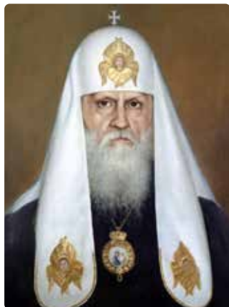
ПИМЕН (Извеков Сергей Михайлович) Патриарх Московский и всея Руси (1971-1990)

Был избран на Патриарший престол в феврале 1945 года. Его Предстоятельство совпало с окончанием Великой Отечественной войны и последующая деятельность была связана с восстановлением разрушенных войной храмов, восстановлением связей с Православными братскими Церквями, было положено начало контактам с Римско-Католической Церковью. Установились активные связи с древними нехалкидонскими Церквями Востока, а также с протестантским миром.