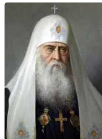
СЕРГИЙ (Иван Николаевич Страгородский) Патриарх Московский и всея Руси (1943-1944)

После 200-летнего Синодального периода). Всероссийский Поместный Собор Русской Православной Церкви восстановил Патриаршество. На Патриарший престол был избран митрополит Московский и Коломенский Тихон. Новому Патриарху пришлось решать вопрос об отношениях с новым государственным строем, враждебно относящимся к Церкви в условиях революции, гражданской войны и всеобщей разрухи.